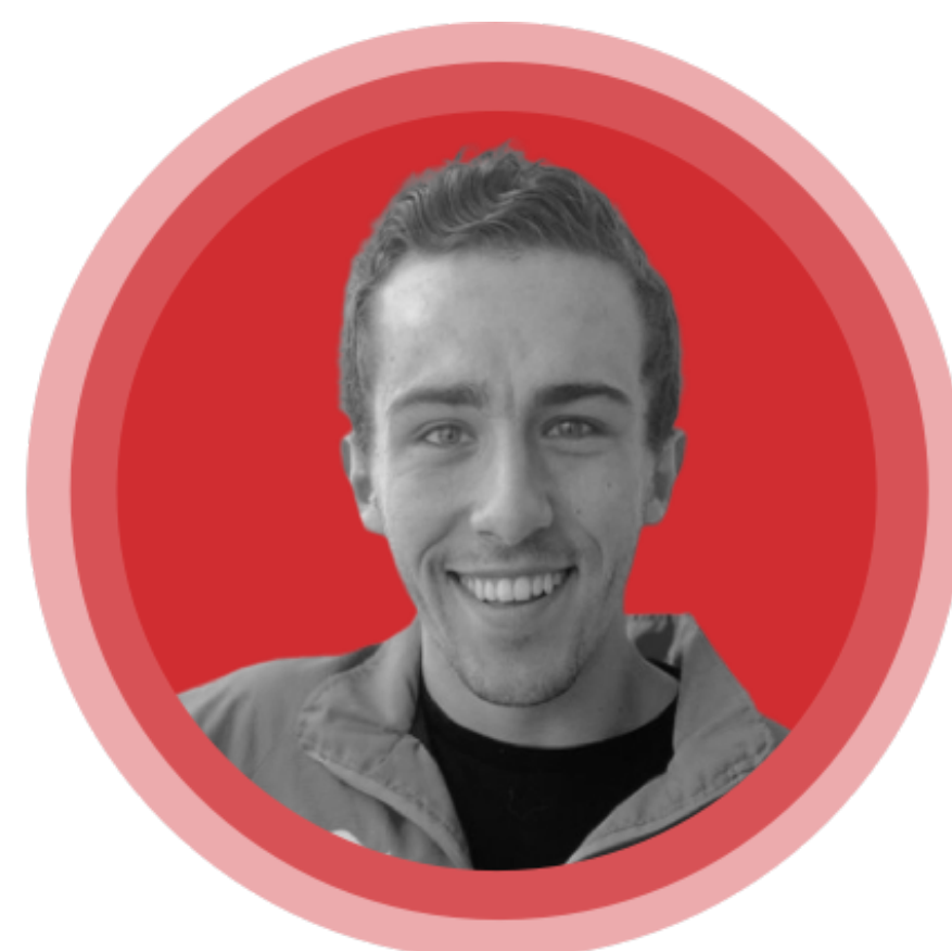
Santiago de la Concha

Trade Marketing for Restaurants & Media en Rappi México y Costa Rica